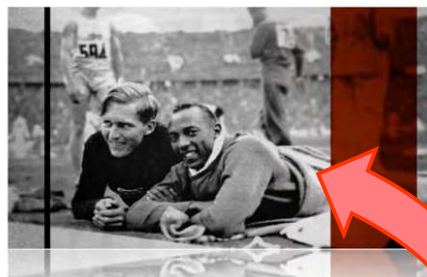
JESSE OWENS LUZ LONG, LE TEMPS D'UNE ÉTREINTE